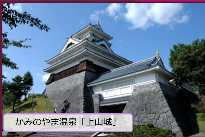
かみのやま温泉「上山城」

山形県は、すべての市町村で温泉が湧く「温泉王国」 日本らしい旅館・ホテルで、 温泉、郷土料理、地酒で、おもてなし 山形の温泉MICEは、国内会議はもちろん、 国際会議でも注目を浴びています。