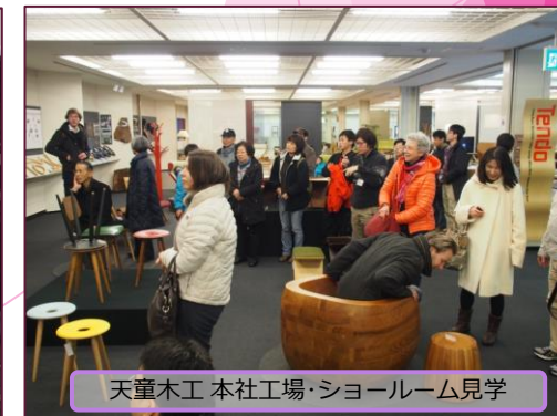
天童木工 本社工場・ショールーム見学