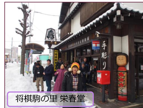
将棋駒の里 栄春堂