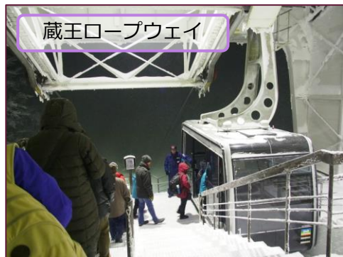
蔵王ロープウェイ