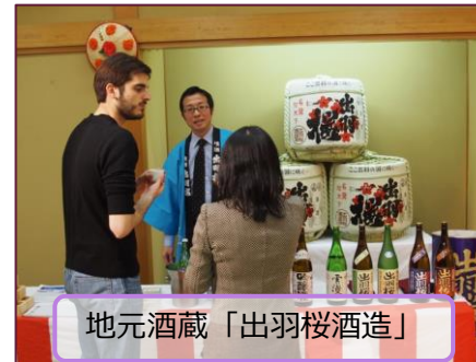
地元酒蔵「出羽桜酒造」