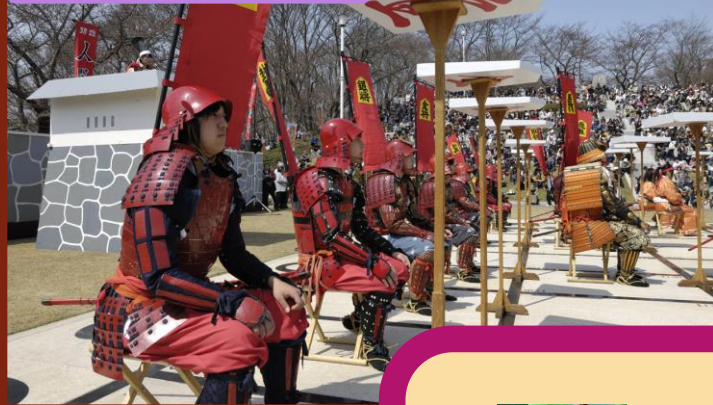
天童温泉「人間将棋」