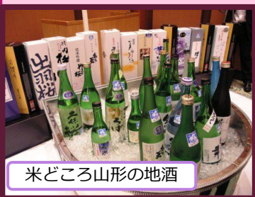
米どころ山形の地酒