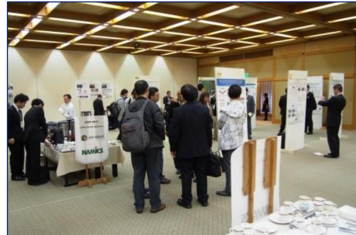
温泉ホテルのコンベンション・ホール、大宴会場でのミーティング使用例